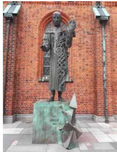
Ansgar-Statue vor dem Dom zu Ribe

Sie sind eingeladen! Feiern Sie mit uns zu Pfingsten beim großen Folkemøde in Ripen – mit Musik, Diskussionen, Gottesdiensten, Tanz und Begegnung. Oder beim Tauffest an der Ansgarwiese bei Haithabu. Oder wandern Sie auf dem dänisch-deutschen Pilgerweg auf Ansgars Spuren. Nehmen Sie teil an Vorträgen, Workshops oder Festen, lassen Sie sich inspirieren vom „ersten Europäer“. Ansgar 2026 – ein Jubiläum, das bewegt. www.ansgar2026.de “