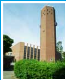
Heilandskirche Saarbrückenstr. 46