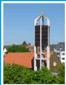
Vicelinkirche Harmsstraße 123