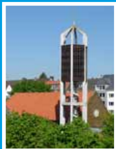
Vicelinkirche Harmsstraße 123